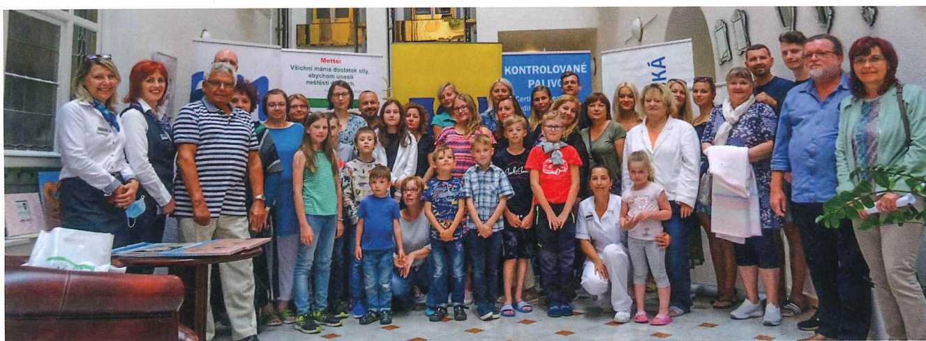
▼ Léčebně ozdravný pobyt nadačních dětí v Mariánských Lázních

Díky osobním kontaktům se sponzory, pořadatelé, účastníky akcí, a to jak policistů a hasičů, tak především široké veřejnosti z různých oblastí našeho života, můžeme v našich řadách přivítat nové podporovatele, které oslovila naše činnost.