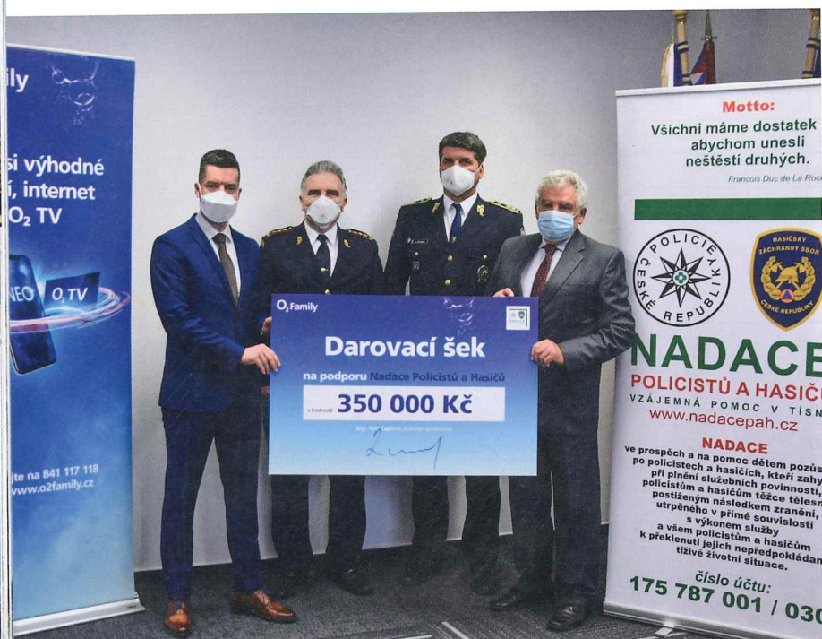
▲ Slavnostní předání symbolického šeku nadaci od O 2 Family

Rok 2020 byl dalším zlomovým obdobím v historii lidstva. Celosvětová pandemie v důsledku vyskytnutého viru covidu-19 změnila životy lidí na celém světě a také celkovou náladu ve společnosti. Je pochopitelné, že se odrazila i v životě nadace. K dosažení svého poslání vyvíjela v roce 2020 činnost v souladu se svou strategií, posláním a plánem. K tomu, aby plány mohla naplnit, zaměřovala v roce 2020 činnost zejména k získávání finančních zdrojů a poskytování pomoci těm, které má ve své péči.