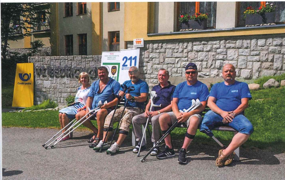
▲ Léčebně ozdravný pobyt těžce tělesně postižených bývalých policistů a hasičů v nadační péči v Bedřichově

O to více pak oceňujeme ty, kteří i v tak složitém období, jímž byl minulý rok, vytrvali jako naši dlouholetí příznivci.